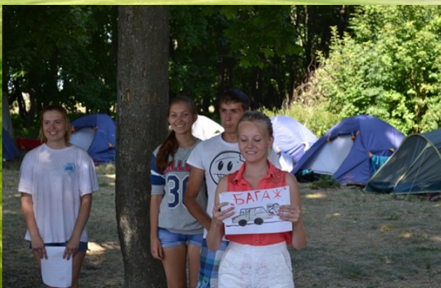
Отдыхаем и выбираем профессию

Муниципальное бюджетное учреждение дополнительного образования «Центр творчества Усманского муниципального района Липецкой области»