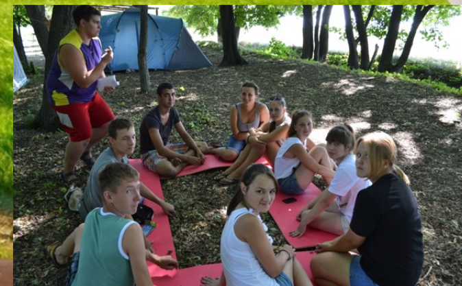
Отдыхаем и выбираем профессию

Профессиональное самоопределение учащихся в условиях организации палаточно-лагерной смены