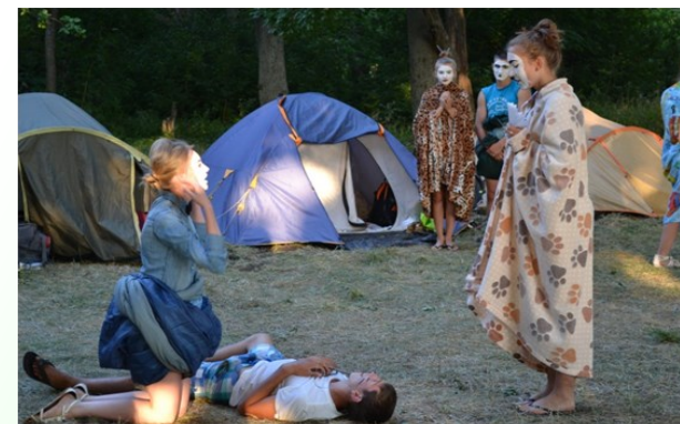
Отдыхаем и выбираем профессию

Основа концепции проориентационного палаточного лагеря - эффективно построенная система по самореализации личности учащегося через включение его в различные виды деятельности с целью формирования представления о мире профессий, получения первичных практических умений, которые в будущем могут оказать большое влияние на предпрофильную подготовку и профессиональное самоопределение личности.