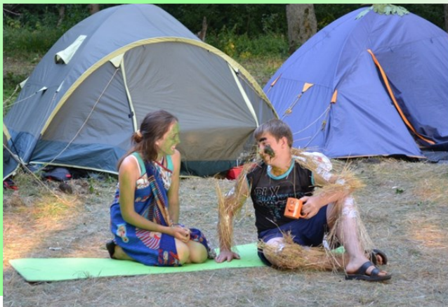
Отдыхаем и выбираем профессию

Данное направление является ключевым и предусматривает ознакомление с миром профессий через встречи и беседы со специалистами, знакомство с «Атласом новых профессий», приобретение опыта профессиональных навыков в ходе занятий по интересам в творческих мастерских, через участие в мастер-классах, проводимых профессионалами различных видов деятельности, деловые игры, квесты.