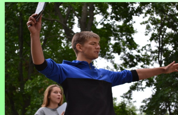
Отдыхаем и выбираем профессию

В программу проориентационной смены следует внести встречи с профессионалами, но не в виде лекций, а в виде мастер-классов, на которых каждый участник попробует себя в качестве специалиста совершенно разных профилей. Конструкторские задачи, реальные квесты, деловые игры, психологически активные дела – вот что должно наполнить план проориентационной лагерной смены. Все это вкупе с творческой средой смены, а также с активной деятельностью каждого из участников должно привести к тому, что наши учащиеся найдут ответы не только на вопросы «Что я умею?», «Чему научусь?», «Чего хочу?», но и на вопрос «Что я буду хотеть?». А это – определяющий вопрос проориентации.